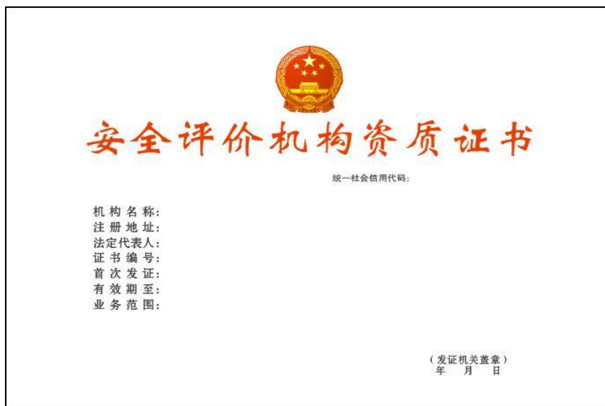
图 1 证书正本格式示意图