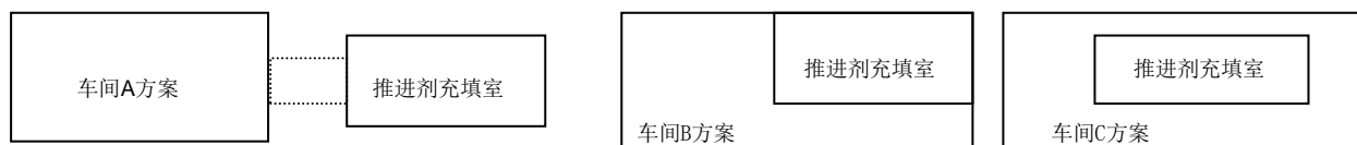
图1 推进剂充填室可能的布局