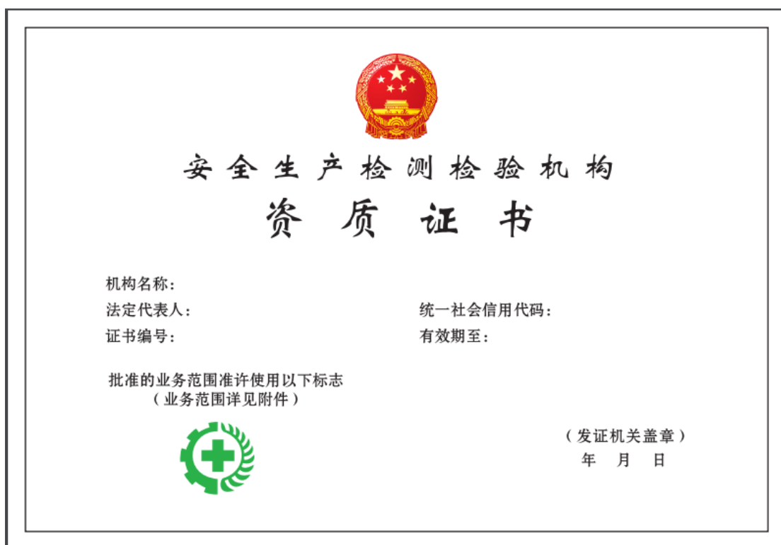
图 1 证书正本式样